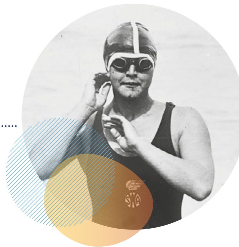
Gertrude Ederle, 1925

14h39. Voici le temps qu'il a fallu à Gertrude Ederle, dite « Trudy », pour parcourir la Manche à la nage. Ce jour-là, le 6 août 1926, elle se présenta au cap Gris Nez en maillot de bain deux pièces, une première dans un lieu public. Alors que beaucoup d'observateurs pensaient la traversée impossible pour une femme, elle impressionna en battant le record masculin de deux heures !