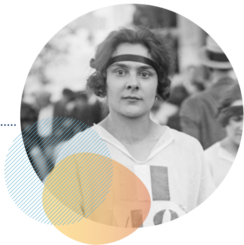
Lucie Bréard aux Jeux Mondiaux féminins, 1922.

Membre du club Femina Sport et enchaînant les records (1902-1988), La Vie au Grand Air lui consacra un article dès 1921. Elle a participé aux premières compétitions internationales ouvertes aux femmes, notamment le meeting de Monte-Carlo en 1921 et les Jeux Mondiaux féminins de 1922 à Paris : elle s'y est distinguée en remportant des médailles d'or dans les épreuves du 800 mètres et du 1000 mètres.